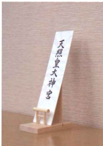
簡易神棚を使って棚の上に