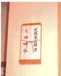
簡易神棚を使って 壁(柱)に